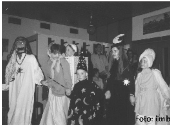
11. januára 2004 otvoril bohatú fašiangovú sezónu v našej obci karneval detí. 7. februára sa uskutočnil športový ples a 14. februára ples organizovaný farskou radou. 22. februára sa uskutočnilo divadelné predstavenie a 24. februára sezónu uzavrie fašiangové stretnutie dôchodcov.