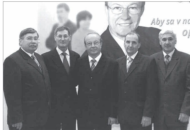
Kandidáti na poslancov a na predsedu VÚC za KDH s predsedom parlamentu JUDr. P. Hrušovským (druhý zľava).