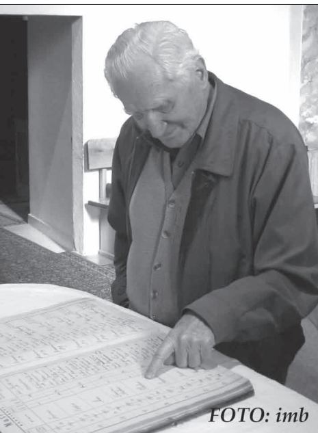
P. Vitko mal najväčšiu radosť zo zápisu v matrike.

Jednotné vstupné 25,- Sk Zmena programu vyhradená!